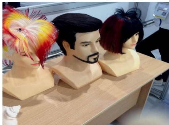
Выпускная квалификационная работа студентов техникума