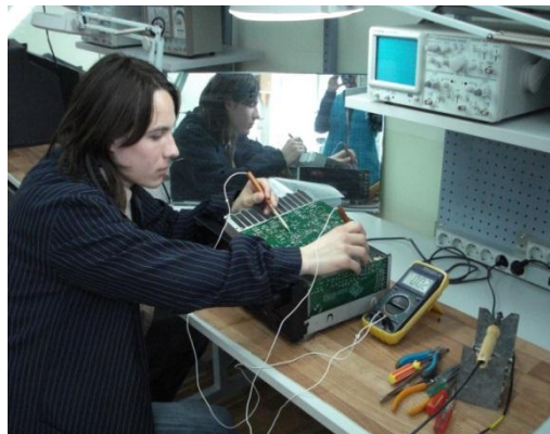
Практика в производственных мастерских